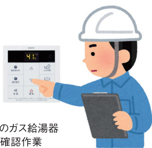
(図2) 現地でのガス給湯器情報の確認作業

中和剤が搭載されています。そして中和剤が無くなると装置は給湯を停止する様に設計されています。当然、設計寿命に対して充分な量の中和剤が搭載されていますが、お湯の使用量が極端に多いご家庭では稀に中和剤切れが発生します。定期点検時に中和剤の残量情報は取得できるので、中和剤の無くなる時期を把握して、事前に中和剤を補給すれば、お湯が出ない不都合は防止できます。