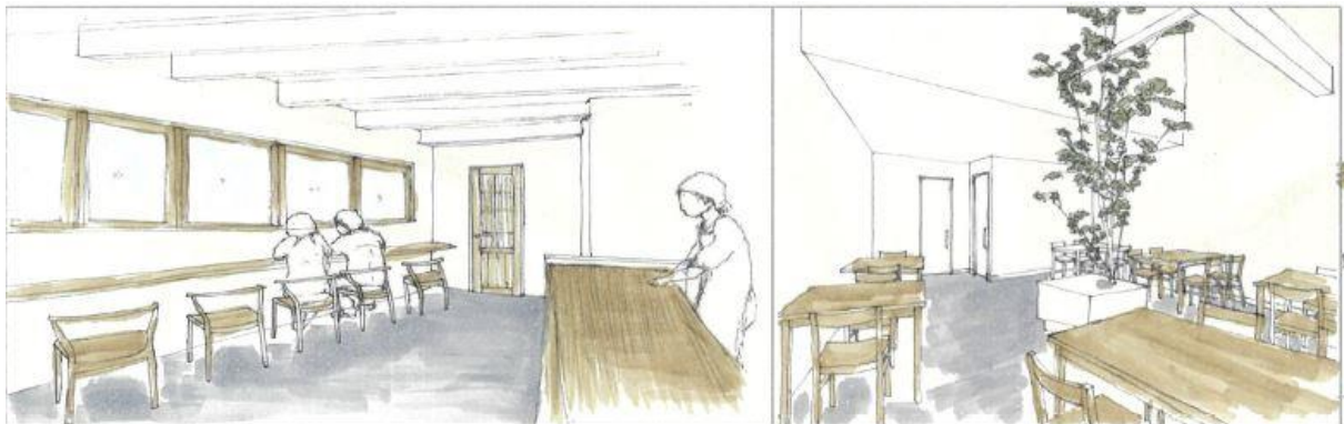
優しいおにぎりとお味噌汁の匂いに包まれる。つい長居してしまうそんな空間。