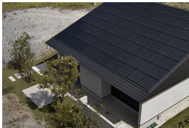
蒸暑地サステナブルアーキテクチャー(2016年)